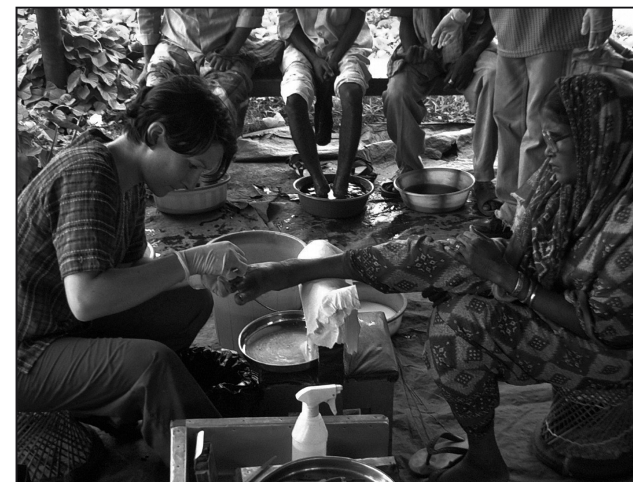
Wondverzorging door een vrijwilliger.