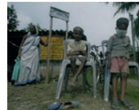
patiënten in TBC project in Canning