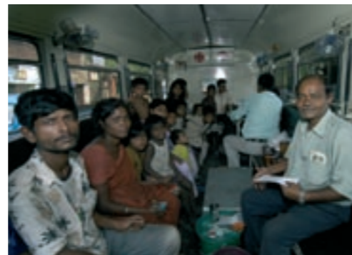
wachtende patiënten in vaccinatiebus