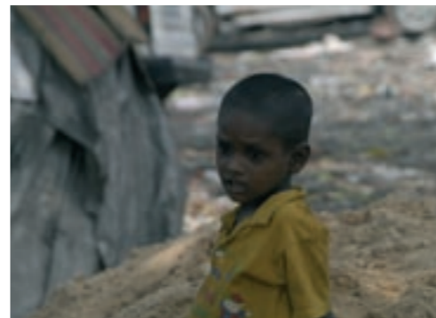
portret van kind in sloppenwijk