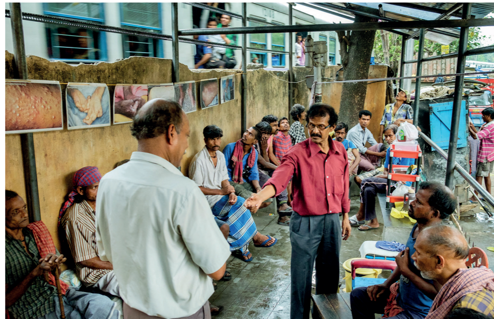
Terwijl achter een trein voorbijraast, geven medewerkers van de kliniek voorlichting aan lepra-patiënten.

De Amsterdamse fotograaf Sake Rijkema was in mei in Kolkata, waar hij onder andere een fotoserie maakte bij de Nimtala-kliniek. Hij stelt ons zijn – prachtige – werk gratis ter beschikking! U ziet hier een selectie van zijn foto's.