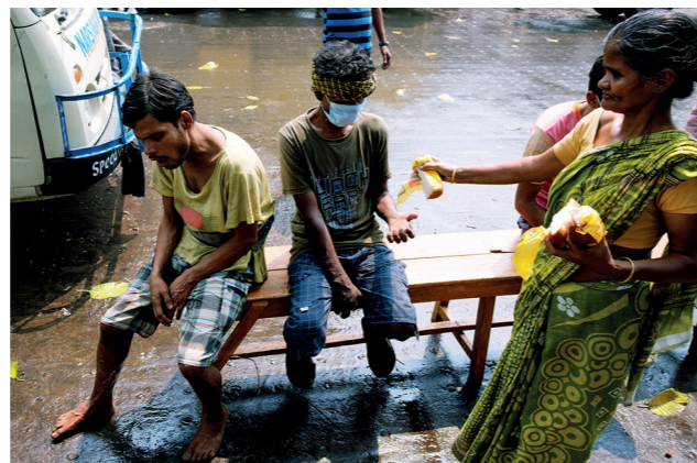
Een patiënt krijgt wat voedsel aangereikt.