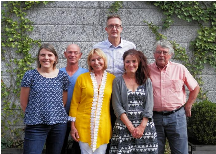
Bestuur Calcutta Rescue Nederland 2017